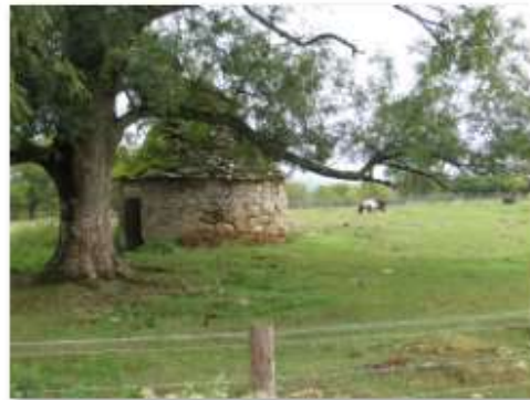
2014-09-29_23_Cazelle vor Mas de la Croix.jpg