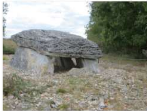
2014-09-29_48_Dolm (alte Grabstätte) nach Gréalou.jpg