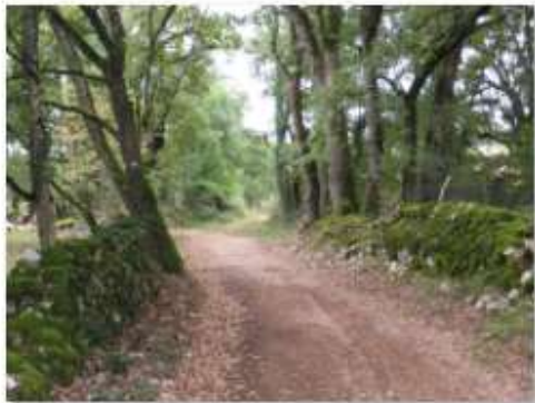
2014-09-29_39_Auf dem Weg nach Gréalou.jpg