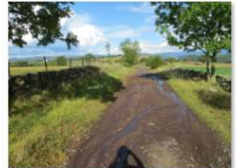
05_2014-09-21_16_Schöner Weg nach Le-Puy-en-Velay nur leicht ansteigend.jpg