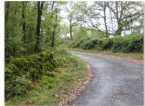
2014-09-29_31_Auf dem Weg nach Gréalou.jpg