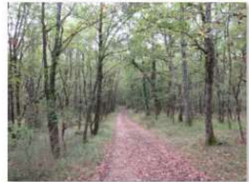
2014-09-29_52_Besondere Stimmung im Wald vor Carjac.jpg