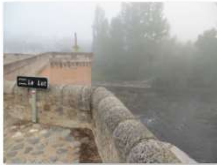
02_2014-09-26_04_Brücke über den Lot.jpg