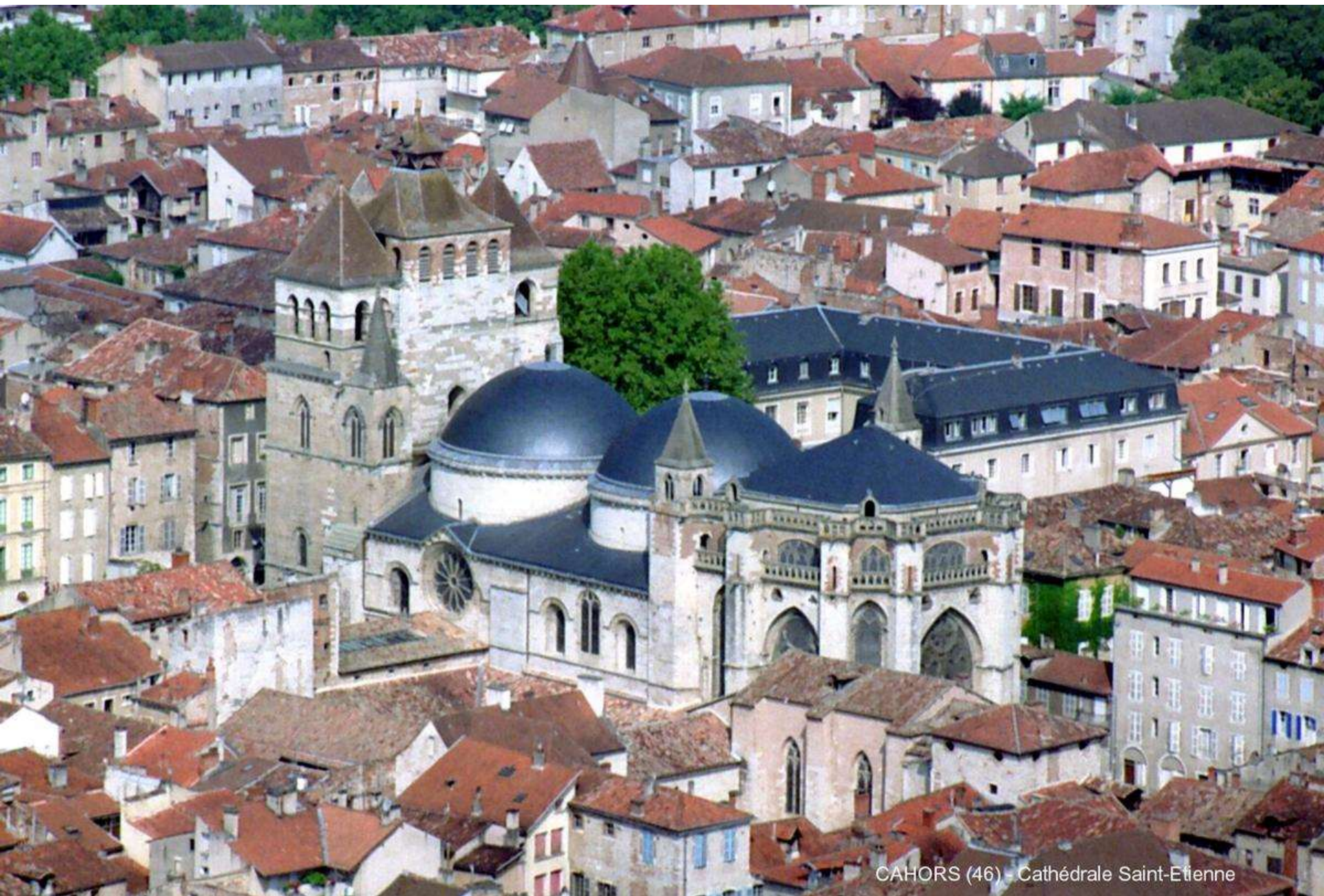
CAHORS (46) - Cathédrale Saint-Etienne