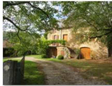
03_2014-09-25_42_Herrenhaus in Saint-Côme-d'Olt.jpg